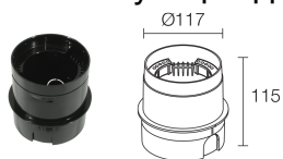
WC0105 Монтажный короб