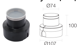
WC4020 Монтажный короб