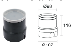
WC4050 Boîtier d'encastrement