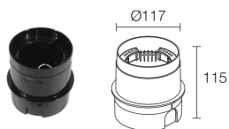
WC0105 Caja de empotrar