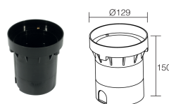
WC0601 Caja de empotrar