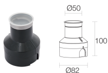
WC4010 Caja de empotrar